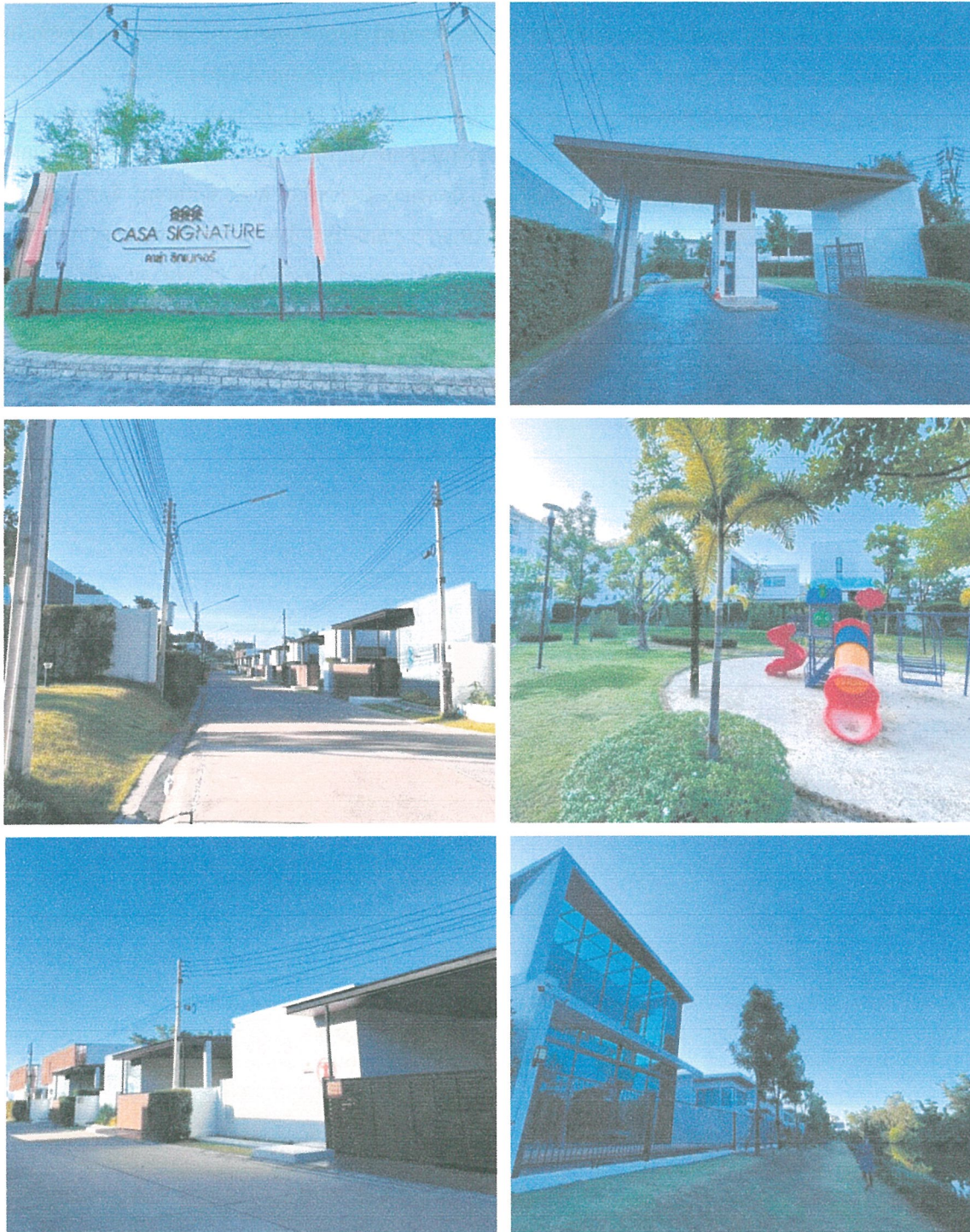
รูปภาพที่ 1.3 การใช้พื้นที่โครงการ